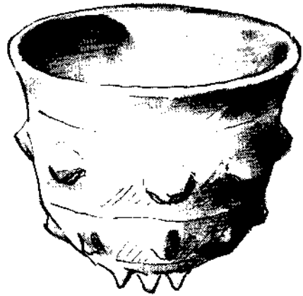
栄螺殻状突起文ガラス碗

ことができ、意外な効果を出すスマートなデザインで、現在でもよく使われている。ただし細工の手際・熟練が必要なのは言うまでもない。たとえばカットの配列の正しさやそのエッジの鋭さなど。